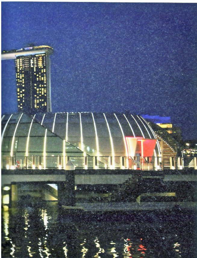
← Über einen Steg, der ebenfalls mit LED-Leuchten ausgestattet wurde, gelangt man auf das Rondell

Die LED Linear Venus-Serie besteht aus flach vergossenen Leuchten in unterschied-