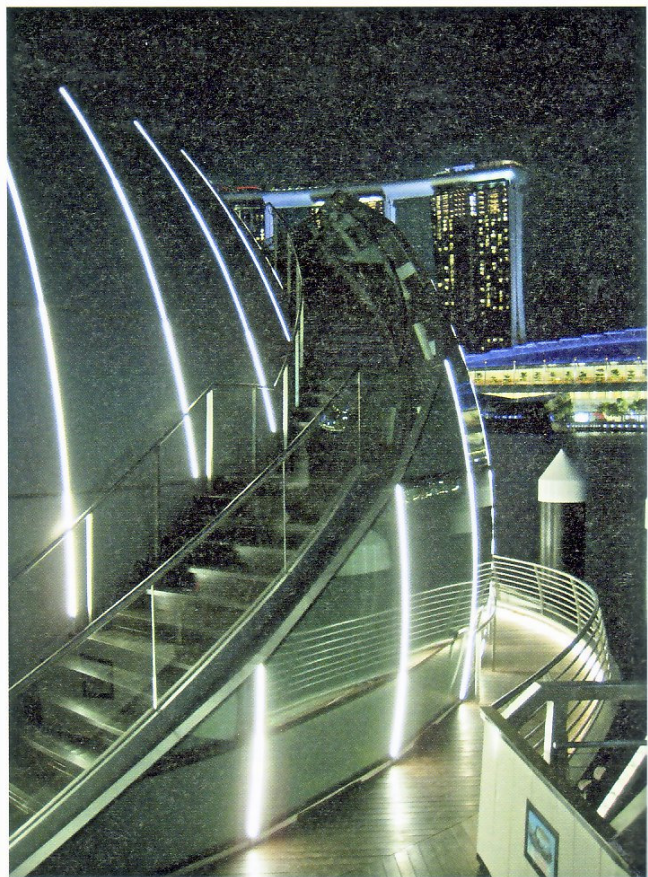
↑ Der Raum zwischen den beiden Kugeln ist mit Treppenaufgängen versehen, die auf die Terrasse führen.

Für das E-Pod wurden drei unterschiedliche Leuchten der LED Linear Venus-Serie verwendet, die neben der außergewöhnlichen Fassade auch die Zugänge zur Insel wie den Steg und die Zugbrücke sowie den Gebäudeeingang und die