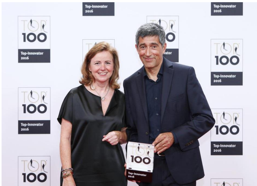
Top 100-Mentor bei der feierlichen Preisübergabe: Ranga Yogeshwar und Jutta Lichter, Marketingleiterin der LED Linear GmbH

Essen – Zum 23. Mal wurden die TOP 100 ausgezeichnet, die innovativsten Unternehmen des deutschen Mittelstands. LED Linear gehört in diesem Jahr bereits zum vierten Mal hintereinander zu dieser Innovationselite und schaffte in der Größenklasse der Unternehmen mit 51 bis 250 Mitarbeitern sogar den Sprung auf Platz 3. Das Neukirchen-Vluyn Unternehmen nahm zuvor an einem anspruchsvollen, wissenschaftlichen Auswahlprozess teil. Untersucht wurden das Innovationsmanagement und der Innovationserfolg. Der Mentor des Innovationswettbewerbs, Ranga Yogeshwar, ehrte den Top-Innovator im Rahmen des Deutschen Mittelstands-Summits am 24. Juni in Essen.